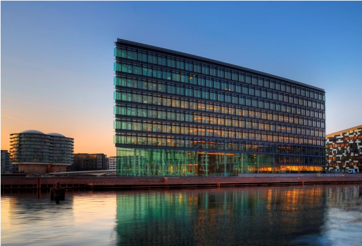
Aller huset ligger centralt på Kalvebod Brygge i København lige ud til vandet.