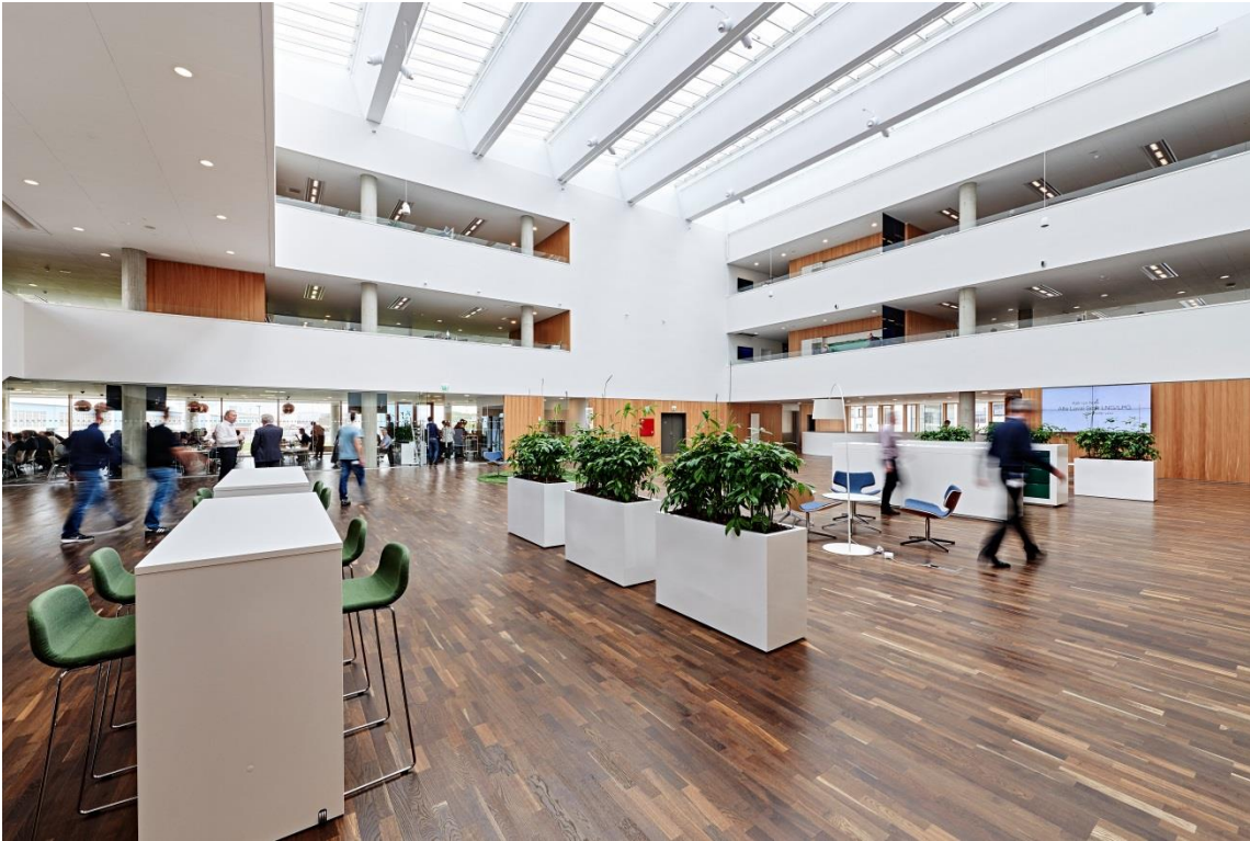
Alfa Lavals nye bæredygtige bygning i Aalborg er det første DGNB-certificerede byggeri i kategorien guld i Nordjylland. Kontoret åbnede i 2015.